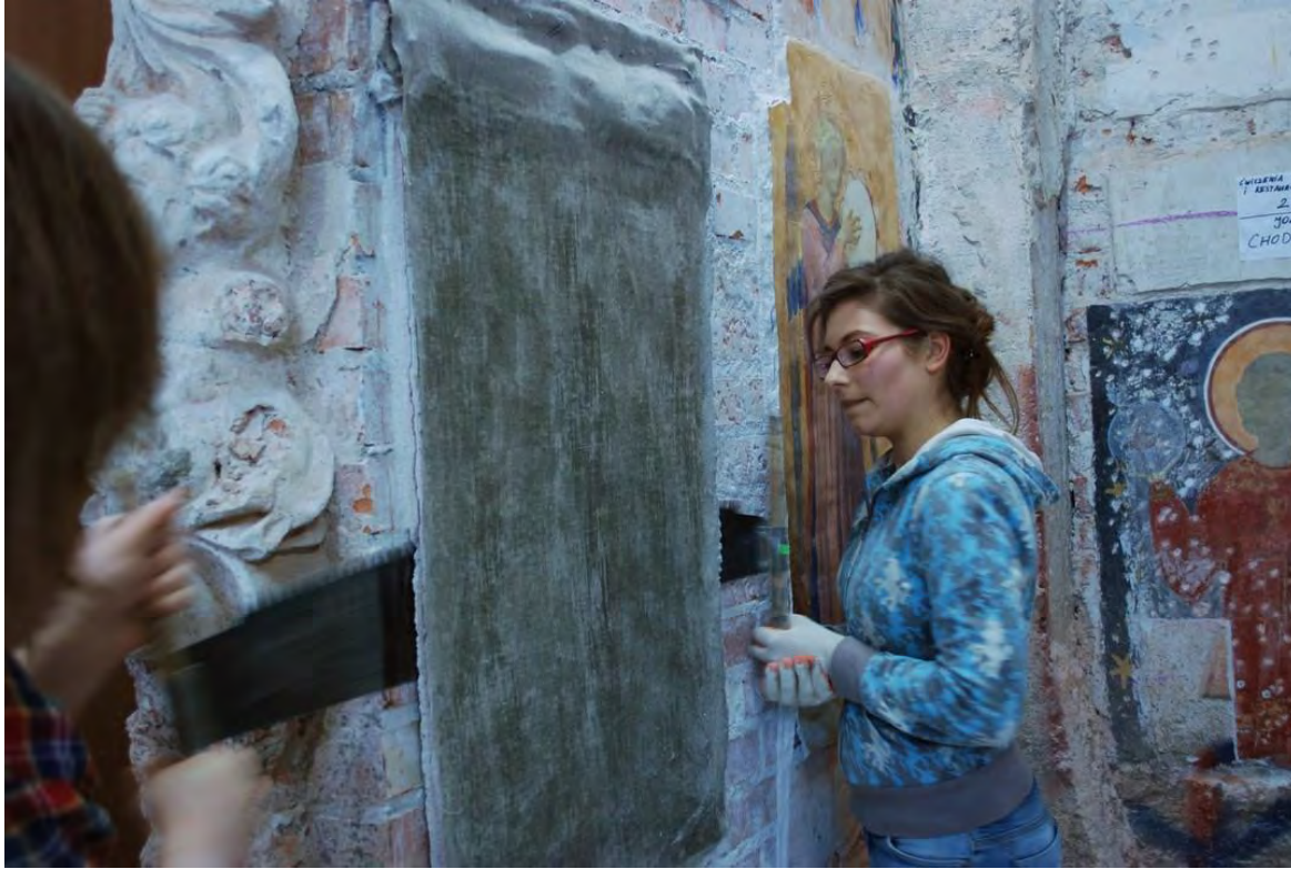
Studentki w trakcie odcinania malowidła za pomocą piły.