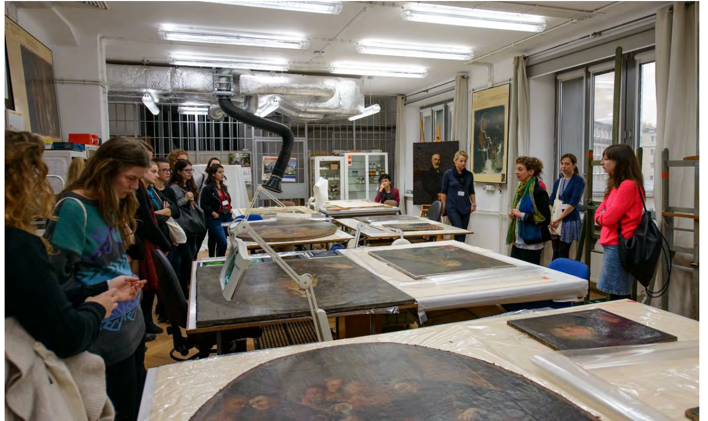
Pracownia konserwacji malarstwa sztalugowego