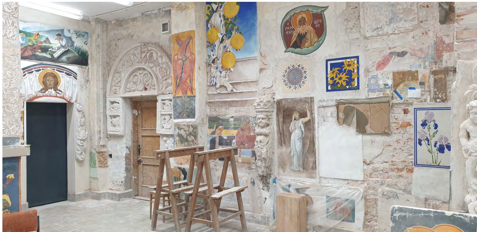
Pracownia technologii malarstwa ściennego