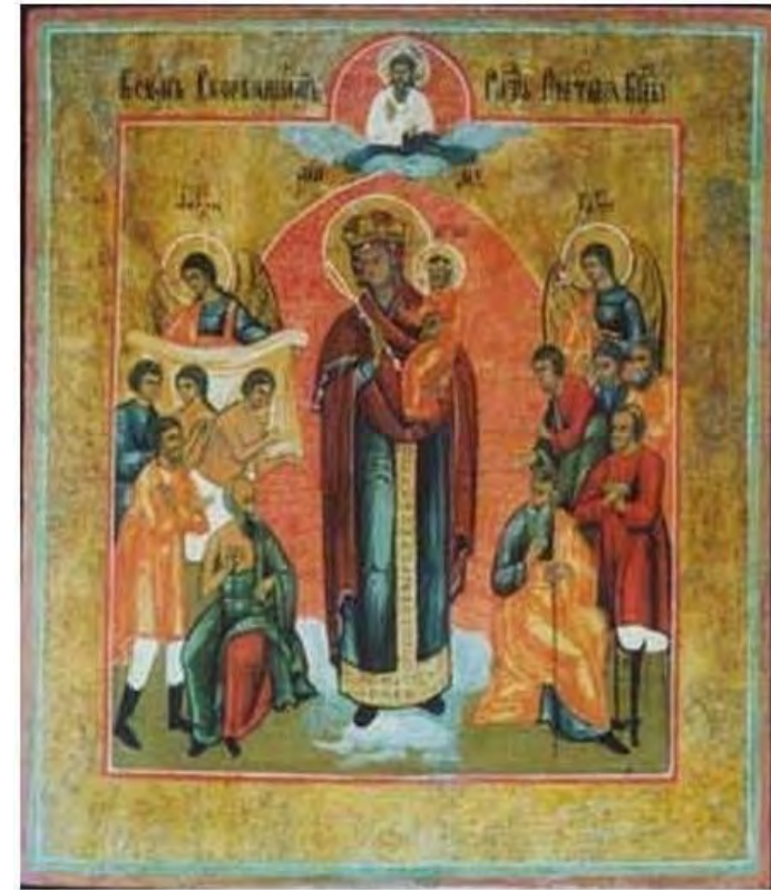
Ikona przed i po konserwacji