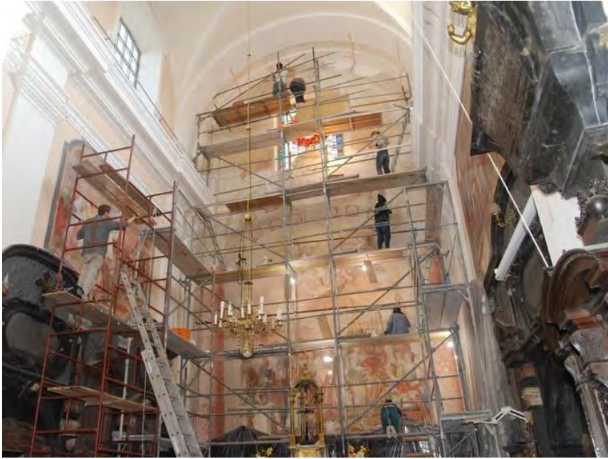
Konserwacja malarstwa ściennego. Praktyki w XVII-wiecznym kościele w Krasnym.