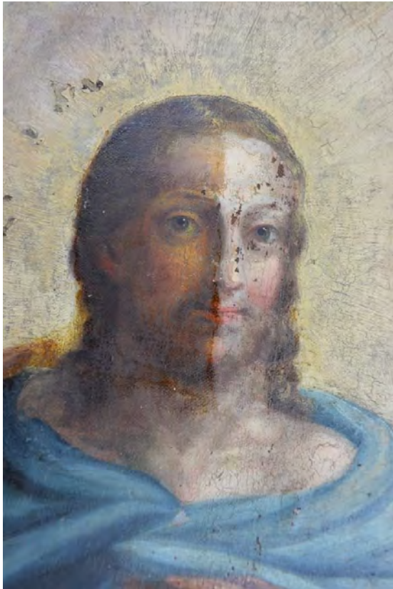
Obraz w trakcie oczyszczania z warstwy pociemniałego werniksu