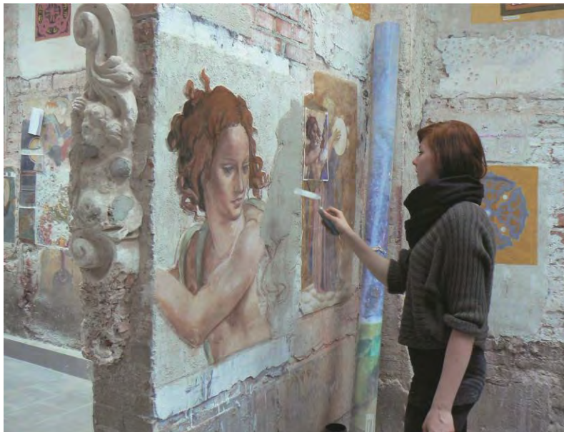
Studentka w trakcie wykonywania malowidła ściennego w technice fresku.