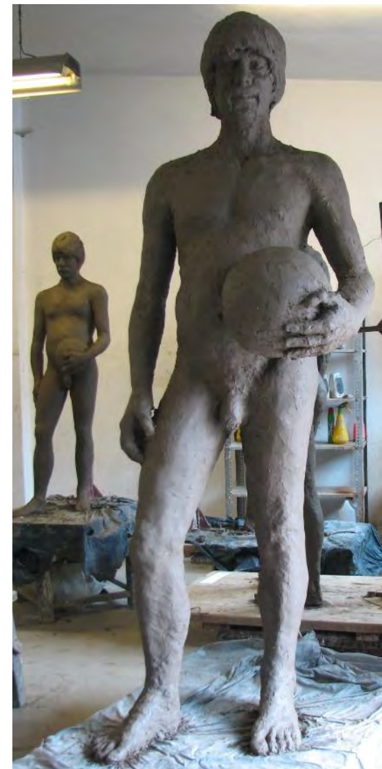
Prace kursowe studentów – studium z modela