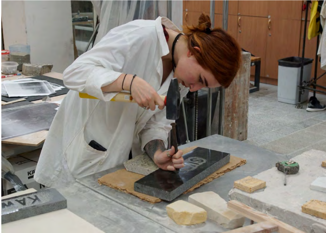
Studentka kująca litery w granicie, w ramach zajęć z technik rzeźbiarskich rzeźby i elementów architektonicznych.