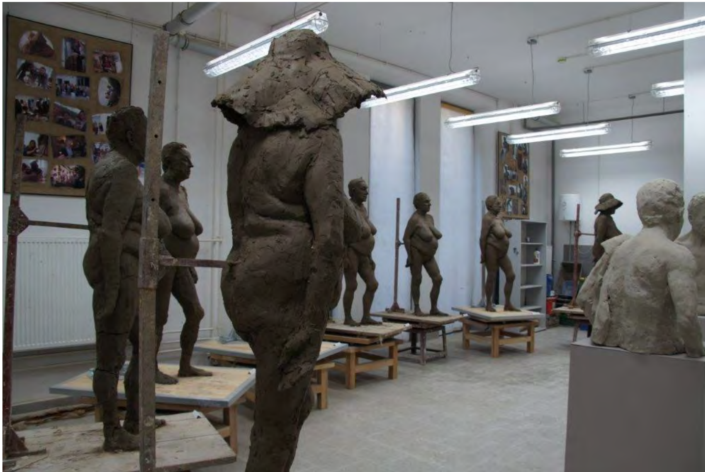
Studium z modela – rzeźby ustawione do przeglądu końcowo rocznego i studenci w trakcie rzeźbienia.