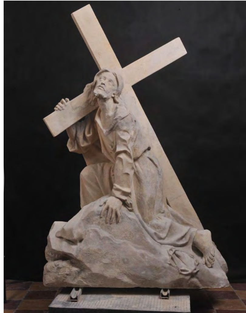
Figura Chrystusa upadającego pod krzyżem z grobowca rodziny Kobierzyckich z cmentarza na Starych Powązkach w Warszawie, stan zachowania przed i po konserwacji.