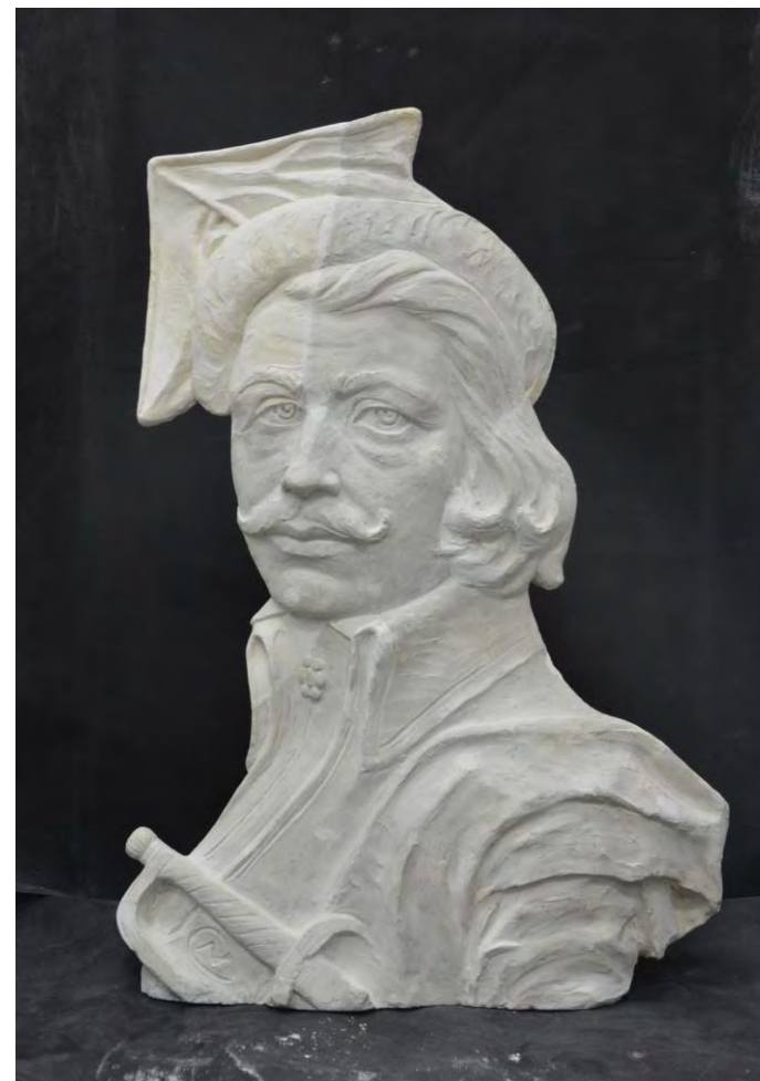
Gipsowa płaskorzeźba z przedstawieniem popiersia Jana Kilińskiego ze zbiorów Muzeum Rzeźby im. Xawerego Dunikowskiego w Królikarni. Obiekt przed i po konserwacji.