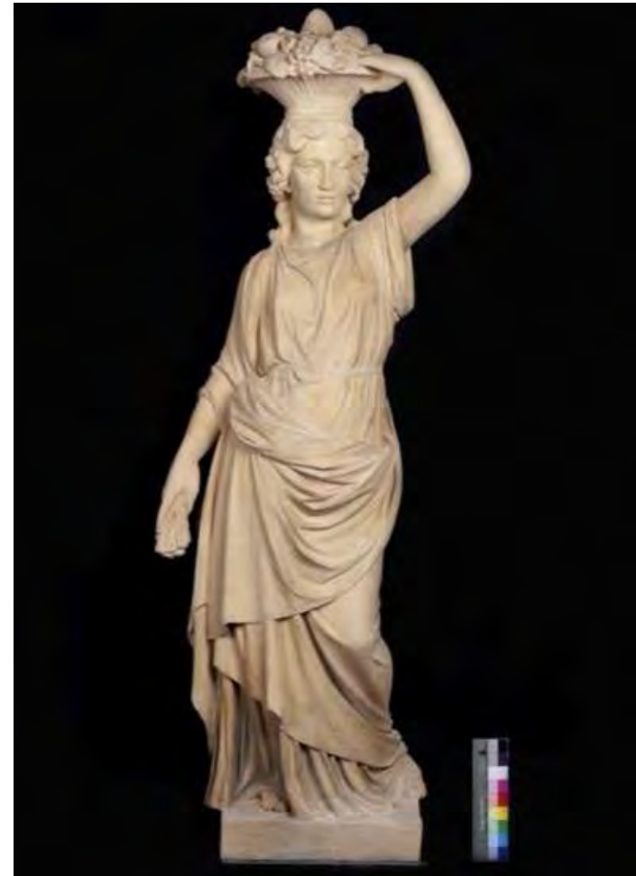
Ceramiczna figura pt. Jesień z kolekcji Muzeum Pałacu Jana III Sobieskiego w Wilanowie, stan zachowania przed i po konserwacji. Praca magisterska wykonana przez Agnieszkę Sienkiewicz.