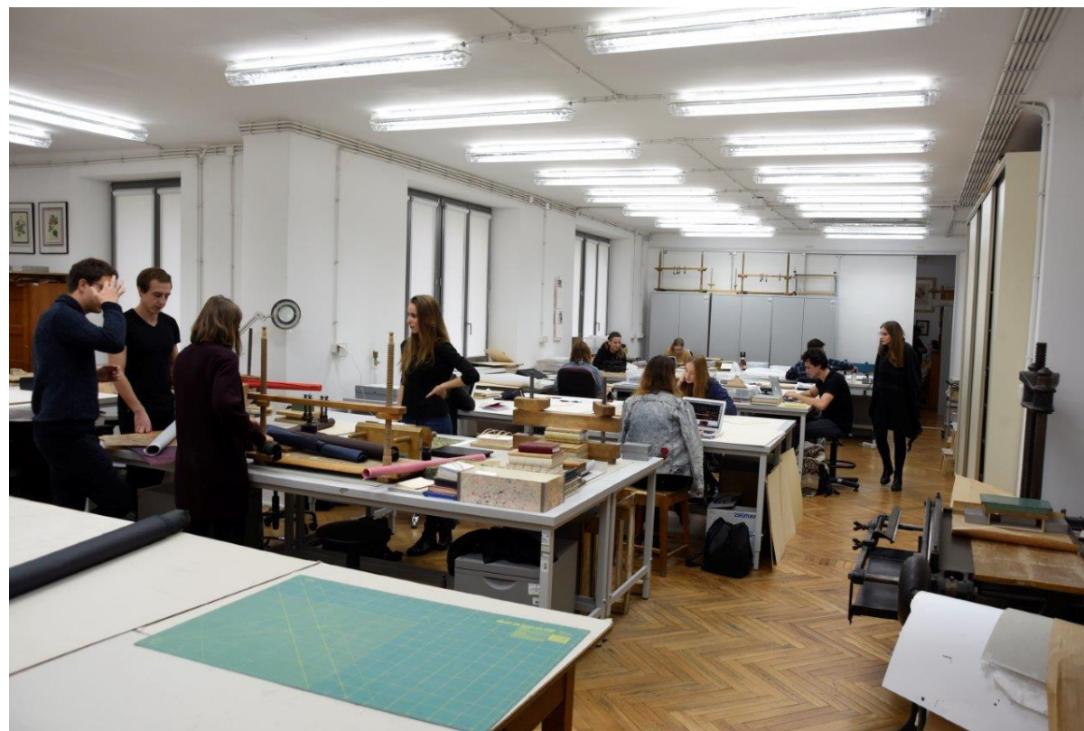
Studenci w trakcie zajęć w pracowni konserwacji