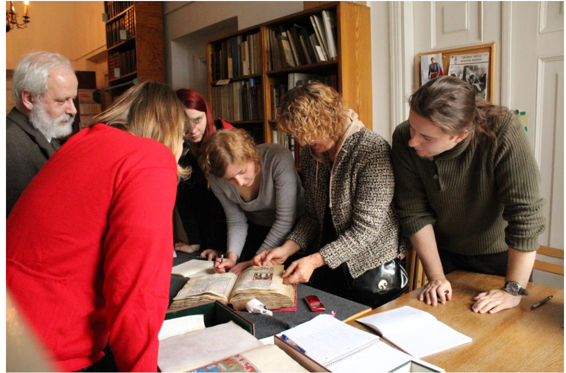
Zajęcia z Kopii Miniatury w Bibliotece Narodowej