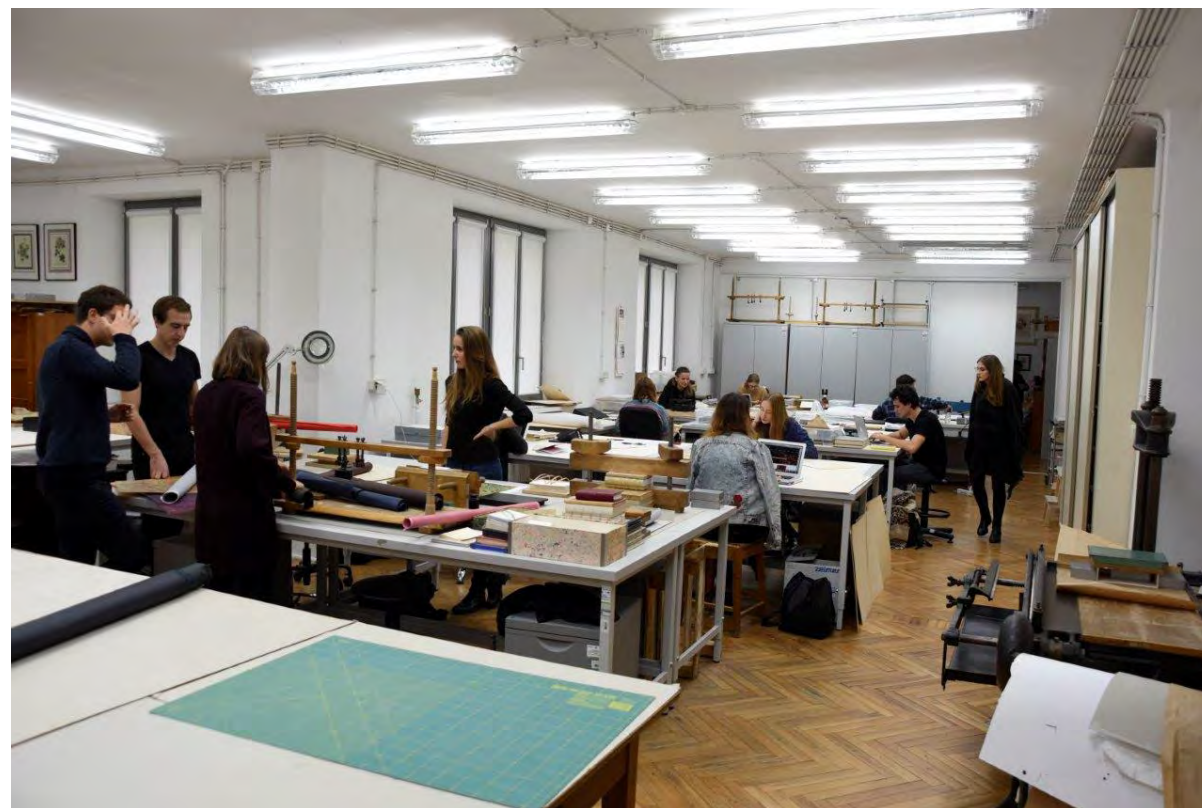
Studenci w trakcie zajęć w pracowni konserwacji