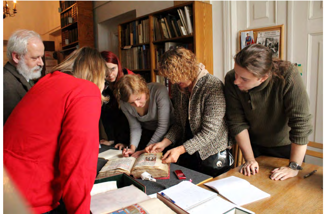
Zajęcia z Kopii Miniatury w Bibliotece Narodowej